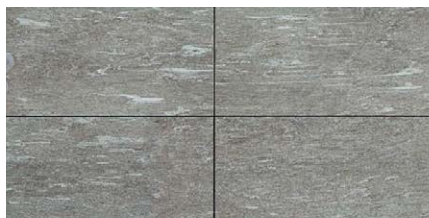
« Calanca » 40 × 120 × 2 cm