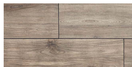
« Holz braun » 40 × 120 × 2 cm