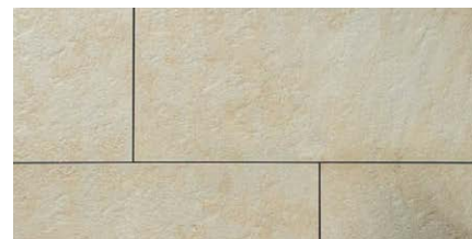
« Sabbia » 50 × 100 × 2 cm 60 × 60 × 2 cm