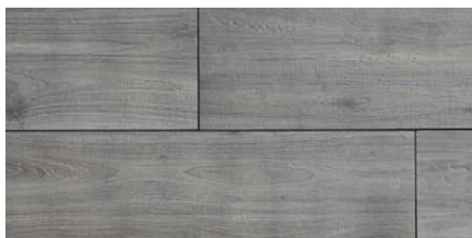
« Holz grau » 40 × 120 × 2 cm