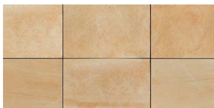
« Sole » 60 × 90 × 2 cm