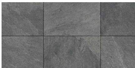
« Schiefer » 60 × 60 × 2 cm